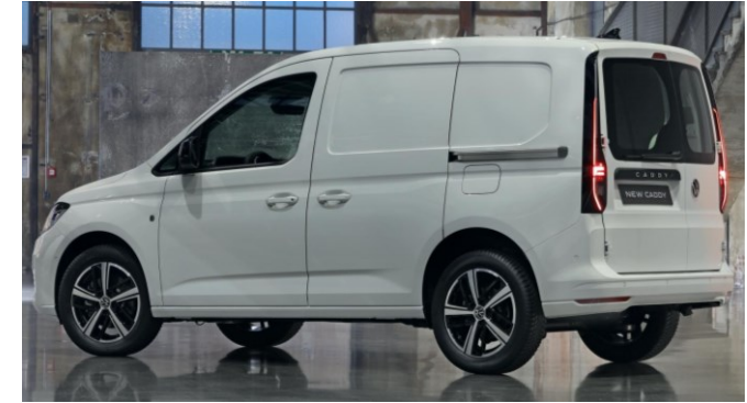
Volkswagen Caddy Cargo