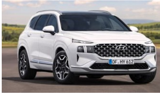
Hyundai Santa Fe